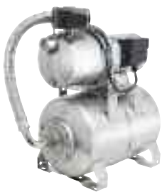
Sonderbau JEM 80/120/150 VA-Kessel und Motorgehäuse aus Edelstahl

Einsatzgebiete: Zum Betrieb mehrerer Regner, zur Gartenbewässerung, Befüllen/Entleeren von Becken und Behältnissen, Wasserversorgung für Häuser (Wochenendhäuser etc.). Fördern von Flüssigkeiten in Industrie, Gewerbe und Landwirtschaft. Für Dauerbetrieb geeignet.