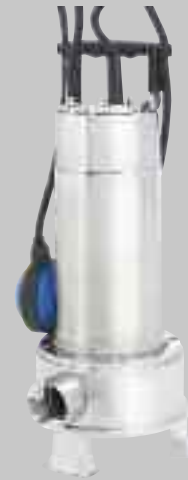
Right 75 MA/100 MA