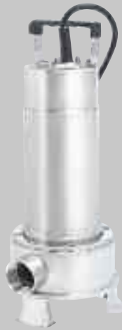
Right 75 M/100 M

Anwendungen: Fördern von Fluß-, Regen- und Schmutzwasser. Einsatz für Schacht- und Kellerentwässerung, Baugrubenentleerung und in überfluteten Bereichen.