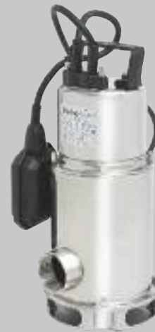
MX 800 MA/1000 MA