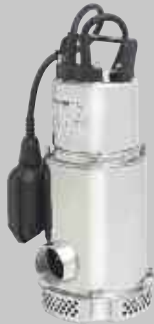
AX 800 MA/1000 MA

Anwendungen: Zum Abpumpen von Wasser, laugenhaltigen Flüssigkeiten und Fördern von aggressiven Flüssigkeiten bis pH-Wert 3. Die Bauweisen sind aus Edelstahl und fast jedem Einsatz gewachsen.