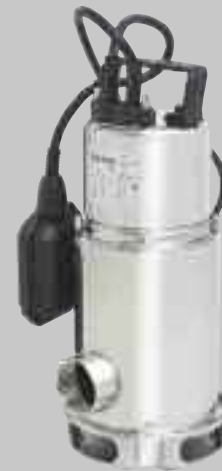
MX 800 MA/1000 MA