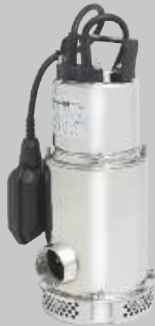
AX 800 MA/1000 MA

Anwendungen: Zum Abpumpen von Wasser, laugenhaltigen Flüssigkeiten und Fördern von aggressiven Flüssigkeiten bis pH-Wert 3. Die Bauweisen sind aus Edelstahl und fast jedem Einsatz gewachsen.