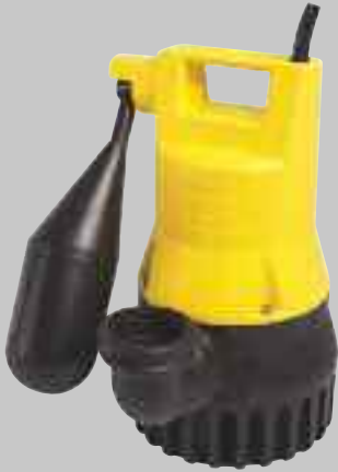
U 3 KS

Anwendungen: Fördern von Regenwasser, leicht verschmutztem Wasser und häuslichem Abwasser, auch aus Haushaltsgeschirrspülern und Waschmaschinen.