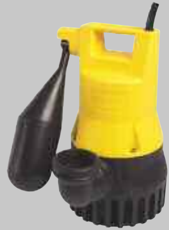
U 5 KS