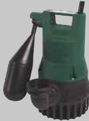
U 3 KS Spezial