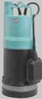
MCS 75 MA

Anwendungen: Entleeren von Becken und Behältern, zur Gartenbewässerung und besonders für Regenwassernutzungsanlagen.