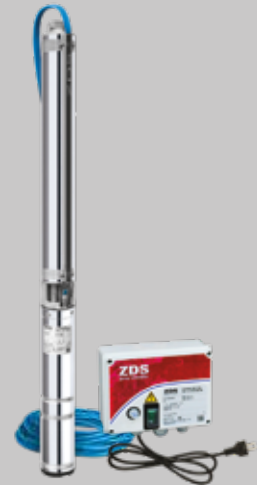
QS 4X Serie 8W