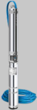
QS 4X Serie 3-8D

Anwendungen: Geeignet für Brunnen bis 130 m Tiefe und mindestens 100 mm Durchmesser. Div. 230V-Pumpen komplett mit Schaltbox, Kabel und eingebautem Thermo-Motorschutzschalter. Zum Fördern von Trinkwasser geeignet.